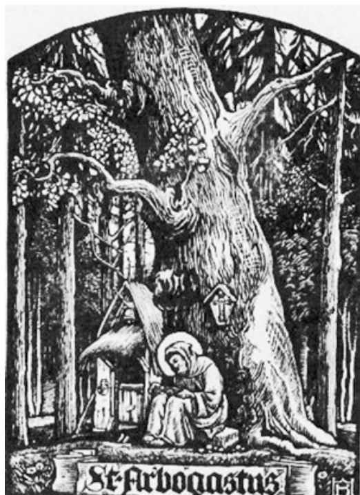
Figure 1. Saint Arbogast ermite retiré en forêt de Haguenau au pied d'un gros chêne. Il devint évêque de Strasbourg à la fin du VIe siècle.

Comme le site de l'ermitage participait à la mortification de la chair, les hagiographes exagérèrent son caractère inhospitalier : les forêts qui retenaient les solitaires ressemblaient à leurs peuples. Cela n'en rendait que plus admirables le dévouement et la dévotion de ces missionnaires comme en témoigne la « loge » de saint Evroul, mélange de branches et de terres en forêt d'Ouche (Orne), « si misérable qu'elle ressemblait à la hutte d'un berger », ou la « niche » de saint Wandrille, perchée sur une fourche d'arbre d'après le vitrail d'Arnières-sur-Iton (Eure). Assurément, l'ermitage était un athlète de la foi, que sa vocation fut contemplative ou éducatrice selon l'âge ou la saison. L'habitat était donc forcément précaire. Parfois, le solitaire utilisait un oratoire pour dormir à même le sol, par exemple dans la chapelle Saint-Maur, au cœur de la forêt de Brotonne (Seine-Maritime). Dans certains cas, l'abri était moins effectif qu'imagé, ce que montre le moine Milon, qui célébrait la messe sur le tronc d'un arbre (VIIIe s.) ou le moine Hardouin, qui enseignait les novices assis sous un arbre (IXe s.).