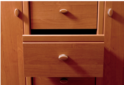
Figure 3. meuble en bois plaqué

Les années 90 furent celles du revirement avec la fin des grandes séries, la nécessité de réagir vite face à la demande des consommateurs changeant leurs modes de vie, où la salle à manger, la chambre à coucher ne sont plus les meubles que les jeunes mariés achètent en priorité. Il faut souplesse et rapidité pour répondre à de petites séries grâce à l'entrée en force de l'informatique et de la robotisation. Les années 2000 marquent un nouveau tournant avec la compétition internationale, les restructurations, les délocalisations pour gagner en productivité et où le design devient primordial. Aujourd'hui les achats des ménages et des collectivités suivent de près la situation économique : la part du budget des ménages consacrée à l'ameublement est tombée à 1%. En période de crise, le meuble est un achat retardé par précaution. L'ameublement, par la baisse des prix, est passé du statut d'équipement à haute valeur nominale à celui de bien de consommation courante.