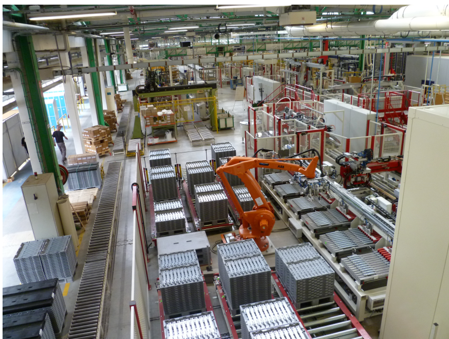
Figure 5. Ligne de montage de meubles de cuisines, usine Fournier Mobalpa de Thônes

Pour les panneaux : pré-débit des panneaux, assemblage des lés de placage, encollage double face des panneaux, pressage des faces, placage des chants, rainurage et perçage, ponçage, mise en teinte, pose de quincaillerie, montage ou emballage.