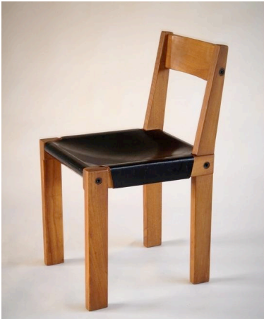
Figure 7. Chaise bois et cuir Photo : Chapo

L'acier, le verre, l'aluminium, les mousses, le cuir, les tissus synthétiques et bien d'autres nouveaux matériaux ont complété le bois et le tissu d'ameublement dans la palette du choix des designers et concepteurs. Ils font appel à des «matériauthèques» comme celle de FCBA. La recherche sur les matériaux innovants et l'ergonomie, l'éco-conception et la conception, étudiée living lab (laboratoire en liaison «visio» directe avec des individus ou groupe d'individus, permettant de tester de nouvelles conceptions de meubles, en conditions réelles ou virtuelles, et la simulation informatique autorisent des progrès sensibles. Par ailleurs, soucieux de la protection de l'environnement, les producteurs ont mis en place au travers de la REP (Responsabilité Elargie du Producteur) deux éco-organismes chargés de la récupération et du recyclage du vieux mobilier.