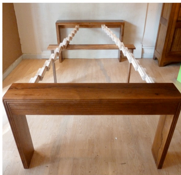
Figure 6. Table console extensible

Quand les modes de vie changent, les désirs d'achat suivent. Nous passons près de 4 heures devant un écran de télévision et d'ordinateur, nos goûts sont analysés par les sociologues qui nous classent en « tribus ». A défaut de pousser les murs, nous privilégions les solutions modulables et sommes plus enclins au changement. Notre mobilier (on parle de plus en plus de composants des espaces de vie où nous passons 80% de notre temps en travail, loisir et repos), doivent être aux dernières normes de sécurité, d'ergonomie, de « durabilité », d'accessibilité aux personnes à mobilité réduite. Aussi attachons-nous une grande importance à l'innovation et la recherche d'une part, au design d'autre part et à la qualification (essais, certifications, comparaisons...). L'attestation de l'origine française des produits fait l'objet d'une demande accrue dans l'hexagone.