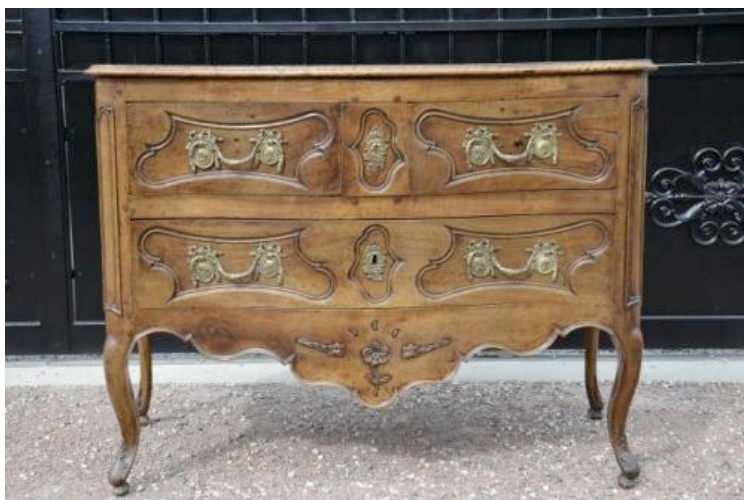
Figure 1. Commode Louis XV style provençal