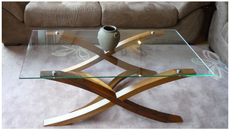
Figure 8. Table basse bois et verre