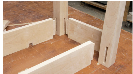
Figure 4. Assemblage par tenon et mortaise